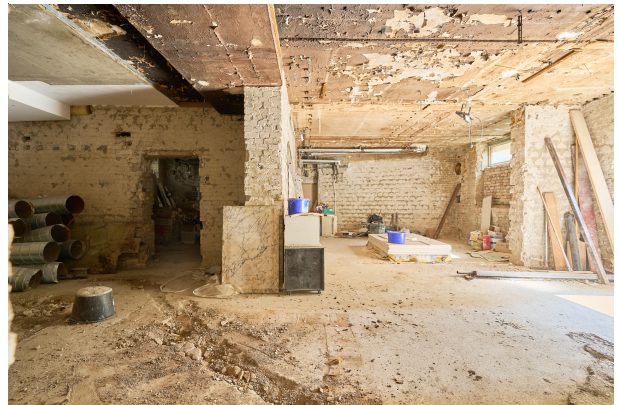
Unverbautes Souterrain gewährleistet viel Helligkeit